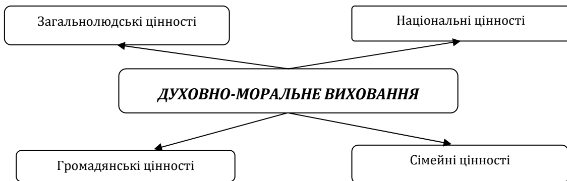
Рис. 1. Цінності духовно-морального виховання

Все вищезгадане тісно переплітається з основними векторами розвитку й удосконалення духовно-морального виховання, орієнтації на загальнолюдські моральні цінності в колективах студентської спільноти, які разом із сімейними цінностями, громадянськими цінностями та національними цінностями, складають систему моральних цінностей у загальній концепції морального виховання особистості (рис. 1).