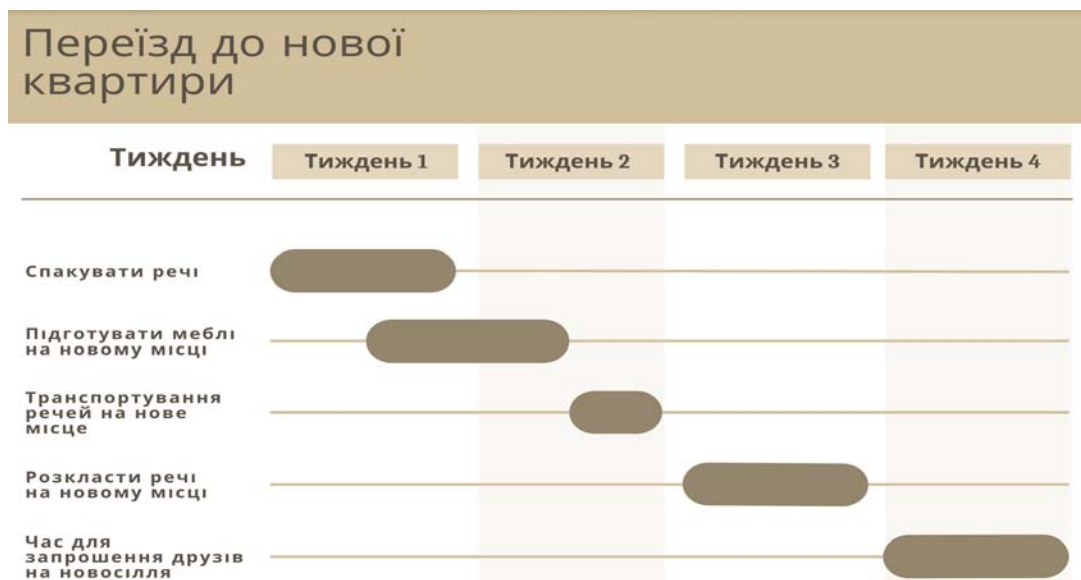
Рис. 1 Діаграма Ганта спрощеного проекту з переїзду до нової оселі. Створено за допомогою хмарного програмного забезпечення Canva ( https://www.canva.com/ ) побудовано автором

Пересічна людина часто планує та контролює такі речі інтуїтивно, не формалізуючи їх навіть у вигляді списку задач, не кажучи вже про діаграми Ганта. Ми переконані, що формалізація таких проектів дозволить значно підвищити рівень їх контролю, а також детермінувати приблизні терміни їхнього виконання. На рисунку 1 зображено спрощений проект з переїзду до нової оселі у вигляді діаграми Ганта.