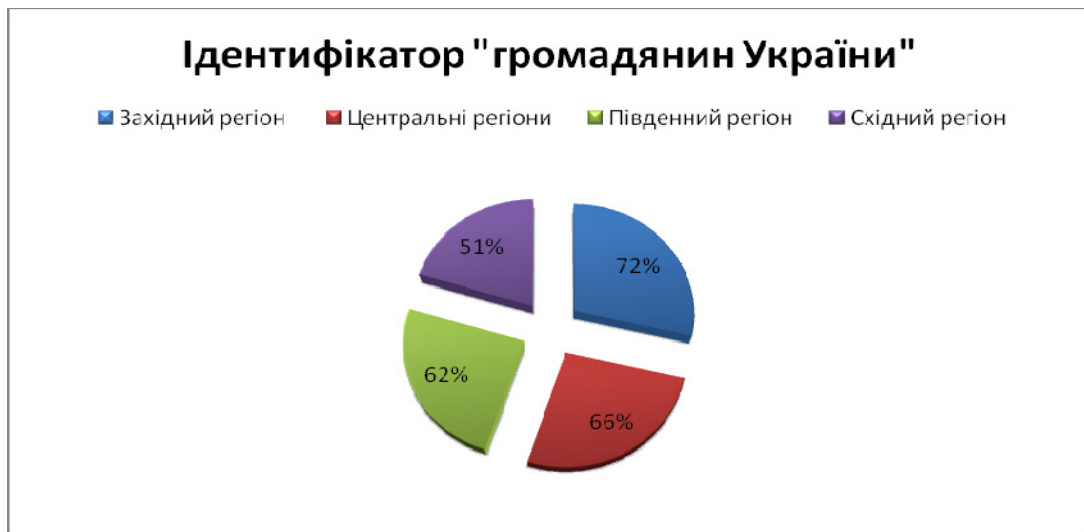
Рис. 1 Ідентифікація громадян України за даними опитування соціологічної групи «Рейтинг у 2019 р. [10]

Загальнонаціональне дослідження громадської думки населення України було проведено Фондом «Демократичні ініціативи» імені І. Кучеріва разом з Київським міжнародним інститутом соціології в серпні 2019 р. констатували низький рівень сформованості цінності державної символіки і дій з її вшанування. Державні символи викликають почуття гордості лише у 25,7% населення України, а День незалежності України для 23% – це просто вихідний день, 4% українців вважають цей день історичною помилкою[11]. Українську мову в родинному колі використовує лише 46% населення, переважно російською мовою користується 12,3% і лише російською 15,8% населення. А про діяльність національно-патріотичних і громадських об'єднань у 2017 році нічого не знали 61% населення і лише 1,1% залучалися до їх роботи. І як результат – у разі виникнення військової загрози, за даними соціологічного опитування жовтень 2018 р., відстоювати територіальну цілісність України із зброєю в руках готові були близько 55% респондентів, а на Сході не мали таких намірів.