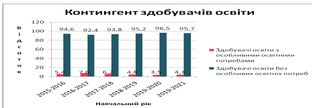
Рис. 1 Контингент здобувачів освіти ДНЗ «Одеський центр професійно-технічної освіти» (2015–2021 рр.).

Окрім того, ДНЗ «Одеський центр професійно-технічної освіти» надає професійну освіту дітям з особливими потребами (зокрема, з порушеннями слуху) як в інклюзивних, так і в спеціальних групах, та забезпечує соціальний захист таких учнів, їх професійну реабілітацію, зайнятість, адаптацію до суспільного життя (рис. 1).