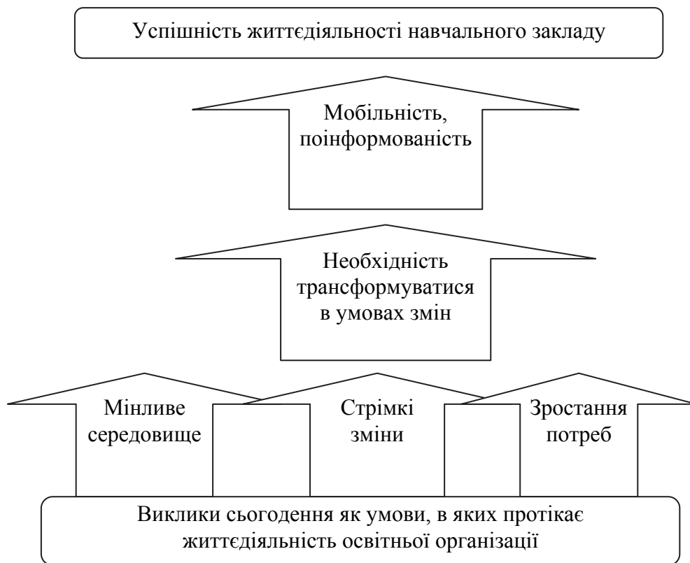
Рис. 1. Чинники успішності життєдіяльності навчального закладу

Саме виклики сьогодення певним чином спонукають до перетворень, що відбуваються як у системі освіти взагалі, так і у кожному навчальному закладі, зокрема. Такі перетворення забезпечують створення умов для відповідного розвитку людського (інтелектуального) потенціалу, що є вирішальним фактором для забезпечення якості, доступності та ефективності діяльності, що, зі свого боку, є сутністю інноваційного розвитку кожного навчального закладу системи освіти.