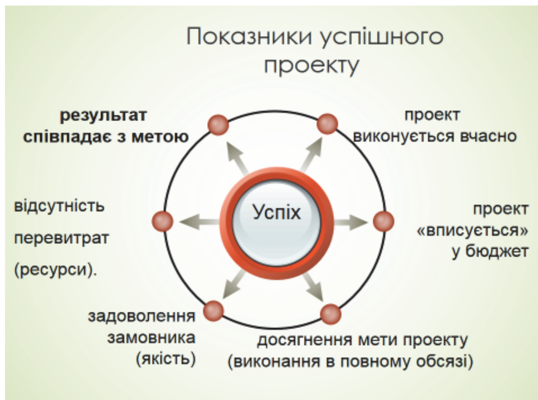
Рис. 5. Показники успіху проекту

Інноваційний розвиток освітньої організації забезпечується плануванням і здійсненням діяльності на проектній основі, перетворенням її на проектно-орієнтовану організацію . Особливостями таких організацій є те, що їх цілі, завдання, структура, стратегія та інші фактори формуються на основі цілей і завдань проекту, а також середовища цього проекту. Показники успіху реалізації освітнього проекту зазначено на рисунку 5.