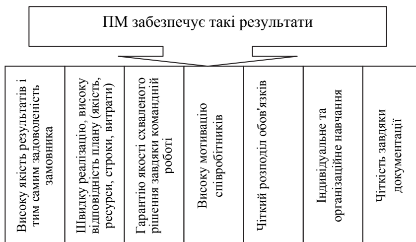
Рис. 3. Аргументи на користь проектного менеджменту

Проектний менеджмент дає змогу знайти баланс між академічними знаннями та практичними вміннями, задовольнити прагнення особистості до вільного вибору діяльності з опорою на зацікавленість та особистісну значущість проблем, що вирішуються (рис. 3).