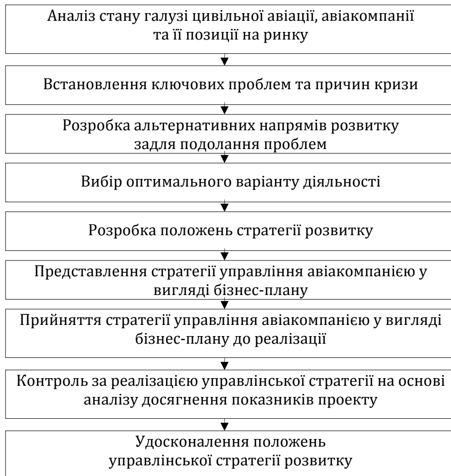
Рис. 1 Етапи управління авіакомпанією на основі бізнес-плану

Відповідно до зазначеного та розуміння сутності управління, процес управління авіакомпанією з використанням бізнес-плану представлено на рисунку 1.