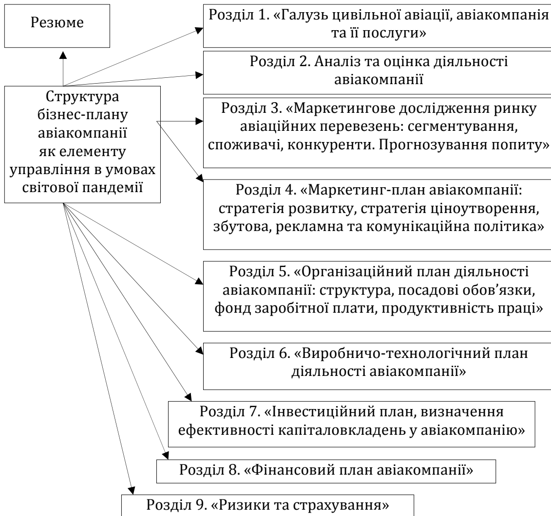
Рис. 2 Уніфікована структура бізнес-плану як інструменту управління авіакомпанією

Отже, при розробці бізнес-плану авіакомпанії, як елементу управління в непередбачених або кризових пандемічних умовах, слід використовувати наступну структуру, яка представлена на рисунку 2.