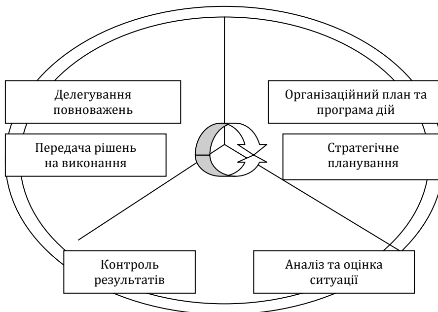
Рис. 3 Стадії управлінського циклу авіакомпанії [13]

Всі стадії управлінського циклу включають як зовнішнє, так і внутрішнє планування, у результаті чого стає можливим зіставлення внутрішніх можливостей і резервів фірми й факторами зовнішнього середовища, що відповідно представлено на рис. 3 [13].