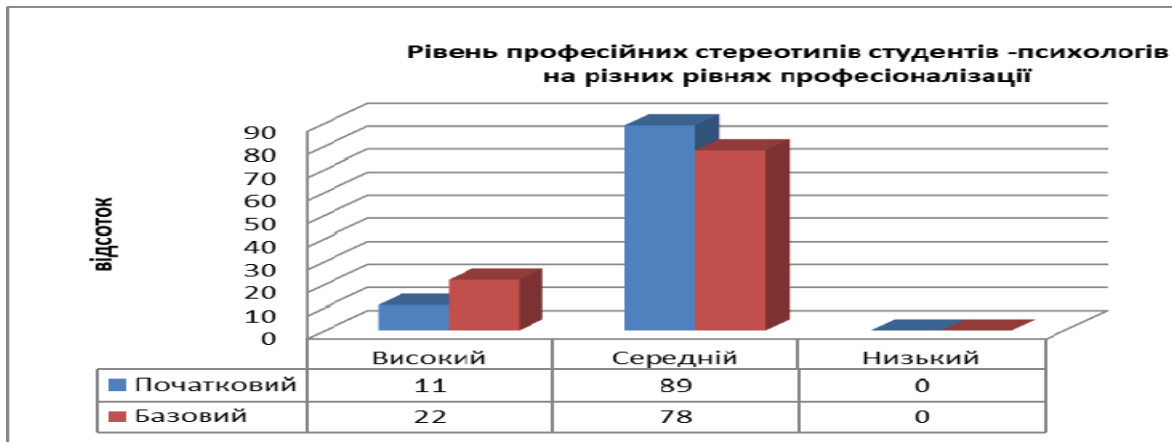
Рис. 1 Рівень професійних стереотипів студентів-психологів на різних рівнях професіоналізації

Середній рівень прояву стереотипів образу професії менш виразний у студентів базового рівня професіоналізації (78% проти 89%), проте в цій групі стереотипна тенденція образу професії психолог збільшується в бік високого рівня, порівняно з групою студентів початківців.