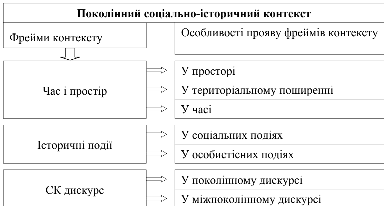
Рис. 1 Структура і прояви контекстуальних аспектів соціально-психологічного простору поколінь

Виокремлений аспект часу і простору дав змогу говорити про існування умовних СК поколінних меж, складних у соціально-історичному визначенні, але таких, що номінують вимоги до організації поколінних культурних текстів. Через те, що історична культурна континуальність у пульсаціях соціальних змін не утворює стабільного СК стилю, натомість функціонує як живий організм – нестабільний, мінливий, такий, що безперервно змінюється, було наголошено, що (1) у текстах акторів знаходить свій прояв культура суспільства; (2) формування СК стилю часопростору відбувається в процесі життєдіяльності поколінь; (3) відмінні СК стилі поколінь підтверджують культурну цілісність – відповідність поколінних культурних текстів соціально-історичним контекстам культурного часопростору. Тобто генераторами стилів СК часопростору зазначено поколінних акторів, навколо яких і відбувається конструювання архітектури світової будови. Оскільки актуальний СК стиль є продуктом актора і водночас регулятором його соціальних взаємодій, було наголошено, що саме історія покоління артикулює континуум часопростору, а фреймами стилю часопростору виступають фактори, що коригують поколінну реальність (див. рис. 1).