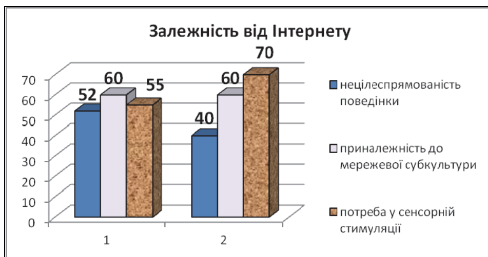
Рис. 2. Особливості інтернет-залежної поведінки серед учнів ЗОШ та учнів ПТУ (1 – учні ЗОШ, 2 – учні ПТУ)

Результати опитування за фактором «Залежність від Інтернету», який складається зі шкал нецілеспрямованість поведінки, приналежність до мережевої субкультури та потреби в сенсорній деривації, представлено на рис. 2.