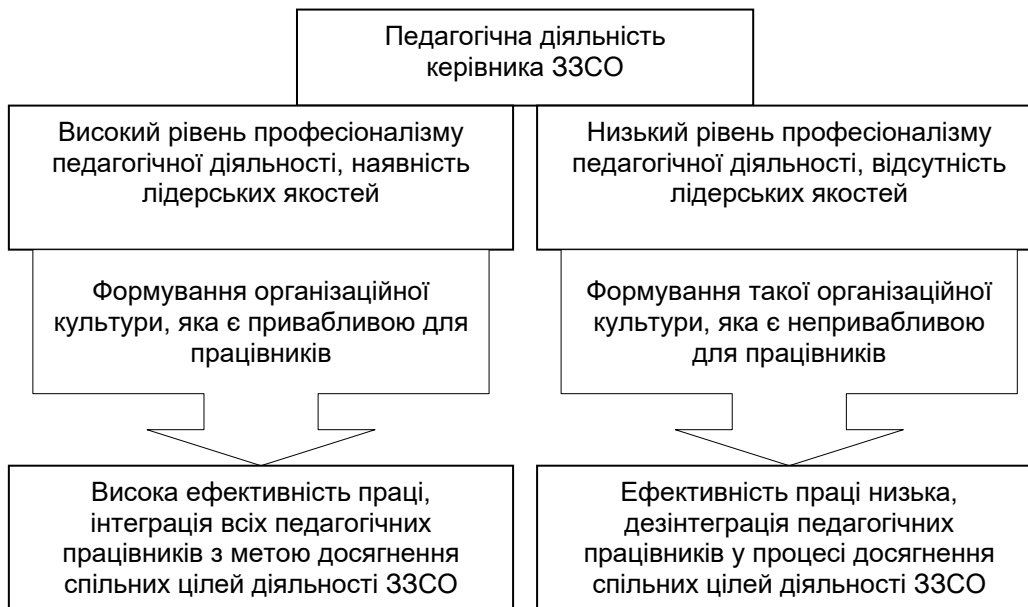
Рис. 3. Вплив рівня професійної педагогічної діяльності керівників на формування організаційної культури школи

Водночас пошук ефективних шляхів оптимізації формування педагогічної майстерності вимагає розуміння його основ та сутності. Так, у Енциклопедії освіти цьому феномену дається таке визначення.