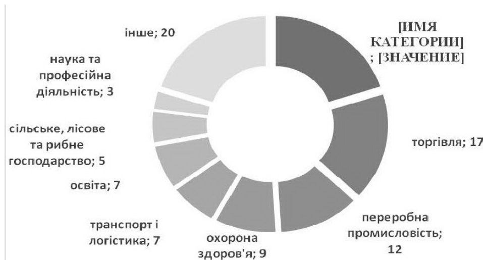
Рис. 3 Структура працівників за видами економічної діяльності, % (с. 22)

Станом на жовтень 2023 року в галузевій структурі зайнятості понад 70 % припадає на 7 основних секторів [7], зокрема державного управління (20 %), торгівлі (17 %), переробної промисловості (12 %), охорони здоров'я (9 %), транспорту і логістики (7 %), освіти (7 %), сільського, лісового та рибного господарства (5 %), науки і професійної діяльності (3 %), інше (20 %) (рис. 3).