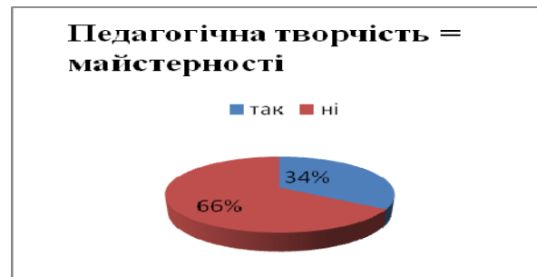
Рис. 4 Кількісний склад опитуваних за їх міркуванням щодо педагогічної діяльності як творчого процесу та майстерності особистості

Аналізуючи відповіді щодо творчого потенціалу вчителя, 32% залишають за собою відповідь про педагогічну діяльність і процес як результат, не звертаючи уваги на творчість. На відміну першим, 68% слухачів обрали педагогічну творчість, а значить творчий потенціал як самореалізацію особистості. На жаль, 44% не вважають висококваліфікованість учителя його конкурентоздатністю, відповідно 56% педагогів відповіли «так», тобто фактично майже половина освітян не вважає висококваліфікованість конкурентоздатністю, а значить конкурентоспроможністю. Іншими словами заперечують фахову компетентність, хоча вона є ознакою конкурентоздатності.