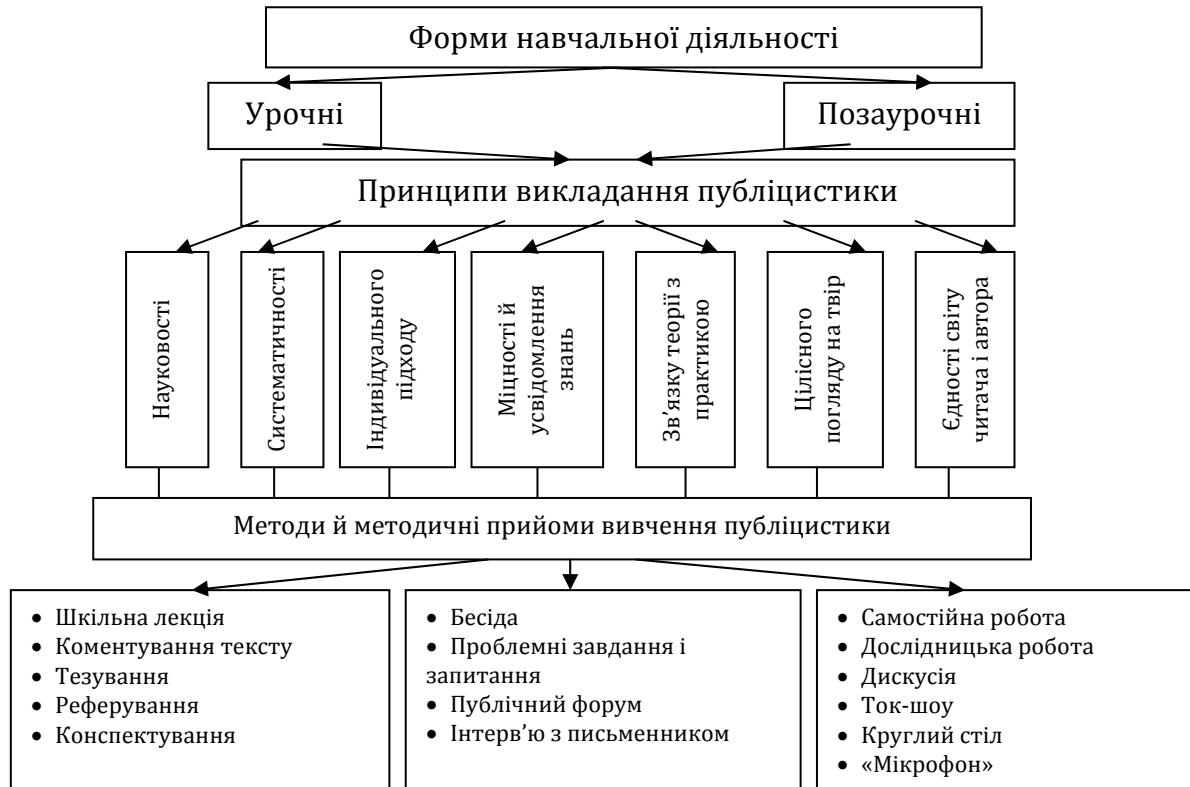
Рис. 3 Структура методичної системи вивчення публіцистичних творів

Методична система вивчення публіцистики у старших класах закладів загальної середньої освіти показано (рис. 3).