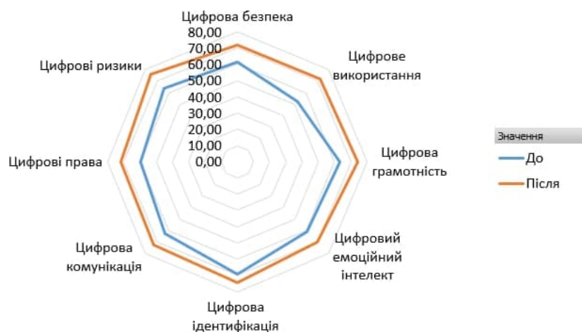
Рис. 3. Рівень сформованості складових цифрової компетентності майбутнього фахівця з економіки

Зведені дані продемонстровано на рис. 3. Таким чином, з точки зору студентів, які самостійно оцінили свій рівень сформованості цифрової компетентності з використанням стандартизованого інструменту «колеса цифрової компетентності» та продемонстрували відповідний прогрес, можна зробити висновок, що розроблена методика, насамперед, сприяє розвитку таких складових цифрової компетентності студентів: цифрове використання (показник сформованості зріс на 20,03%, цифрові права – на 12,18%, а також цифрові ризики – на 12,09 %, цифрова безпека – на 10,91% (рис. 3).