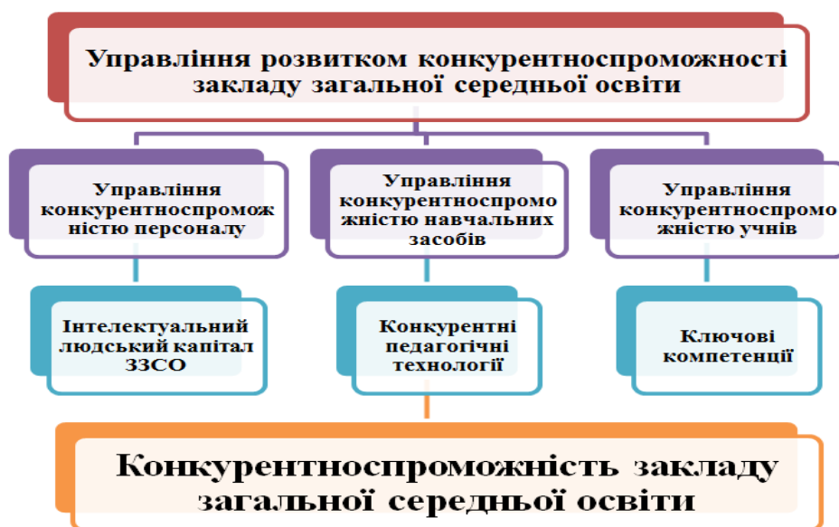
Рис. 2 Інтегральна модель управління розвитком конкурентоспроможності закладу загальної середньої освіти [власна авторська розробка]

Управління розвитком конкурентоспроможності закладу загальної середньої освіти, як певна інтегрована якість, спрямовується на постійне забезпечення конкурентоспроможності персоналу, учнів та навчальних засобів. Спираючись на вищесказане, ми взмозі запропонувати інтегральну модель управління розвитком конкурентоспроможності закладу загальної середньої освіти, яка враховує визначені критерії (див. рис. 2).