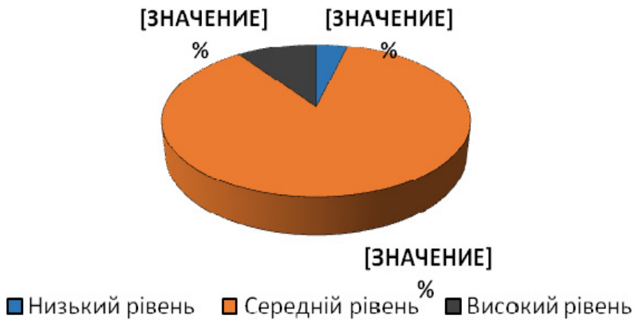
Рис 2 Розподіл стану «відчуженість» у підлітків

З даних діаграм (рис. 1, рис. 2) спостерігаємо, що серед підлітків екзистенційно-конфліктні стани «самотність» і «відчуженість» з високим рівнем вираженості зустрічаються досить рідко – не перевищує 11%. При цьому, стан відчуженості спостерігається дещо частіше, ніж стан самотності. Цей факт заслуговує на пильну увагу з боку фахівців, оскільки рефлексія переживання відчуженості для підлітків є у край важкою, а невирішені екзистенційні конфлікти можуть істотно деформувати надалі життєвий шлях особистості. Дані розподілу, які отримані для екзистенційного стану «самотрансцендентність» представлені на діаграмі (рис. 3).